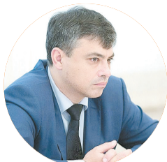
Дмитрий Анатолевич Морозов председатель Комитета Государственной Думы по охране здоровья:

«Нет задачи важнее сохранения и укрепления здоровья людей и коллектив вашей больницы блестяще справляется с этой задачей».